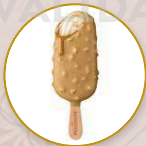
Magnum Double Gold Caramel Billionaire Helado sabor galleta, chocolate golden y salsa de caramelo.