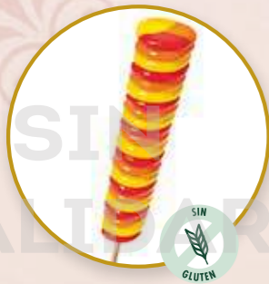
Twister Sorbete de limón, naranja y fresa.