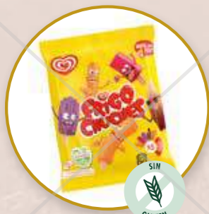
Frigo Chuches Mini helados sabor chuches.