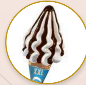
Cornetto XXL Chocolate Helado de chocolate tamaño XXL.