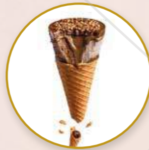
Cornetto Max Avellanas y Chocolate Nocciola Cono de helado de chocolate y salsa de nocciola.