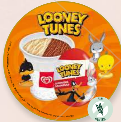
Huevo Sorpresa Looney Tunes Copa de helado con juguete.