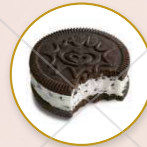
Cornetto Go Nata y galleta de chocolate.