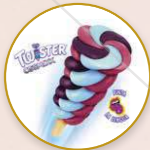
Twister Cosmixx Helado de hielo sabor frutas del bosque.