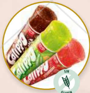
Gama Calippo Lima-limón, fresa o cola.