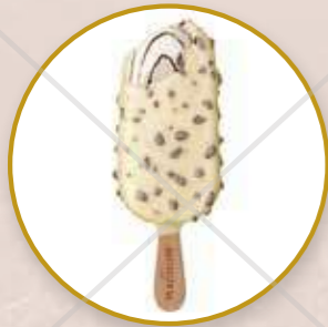
Magnum White Chocolate & Cookies Helado de nata y cookies.