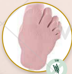
Frigo Pie Helado de fresa con forma de pie.