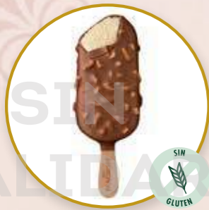
Magnum Almendras Vainilla, chocolate y almendras.