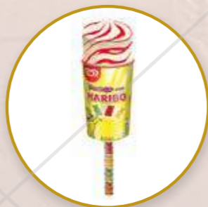
Haribo Helado de vainilla y salsa de fresa.